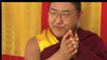
l'H.H. le Sakya Trizin 41

Sa Sainteté le 41ème Sakya Trizin est né dans le Tsedong, au Tibet, en 1945. Il est à la tête suprême de l'École de Sakya, une des quatre écoles principales de bouddhisme tibétain. Sa Sainteté appartient à l'ancienne famille distinguée royale de Khön, dont l'histoire remonte aux premiers jours du Tibet, alors que le bouddhisme n'y était pas encore arrivé. Dès l'âge de 3 ans, il a commencé à recevoir toutes les initiations et enseignements majeurs de la tradition de Sakya, y compris ceux des doctrines bouddhistes tibétaines ésotériques les plus avancées. En 1951, à l'âge de 6 ans, il reçut formellement le titre de Sakya Trizin (le Porte-Trône de Sakya) du Dalai Lama - ainsi devenant 41ème héritier de cette position. En 1959, il fut forcé à quitter son palais royal et à fuir en Inde suivant l'invasion chinoise du Tibet.