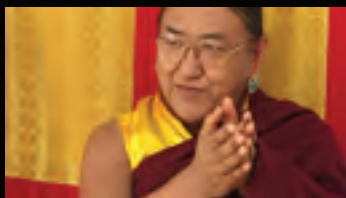
H.H. der 41. Sakya Trizin

Seine Heiligkeit der 41. Sakya Trizin wurde 1945 in Tsedong in Tibet geboren. Er ist der Thronhalter der Sakya-Tradition, einer der vier Hauptschulen des tibetischen Buddhismus. Seine Heiligkeit stammt von der alten, angesehenen Königsfamilie Khön ab, die auf die Anfänge Tibets zurückgeht – in die Zeit bevor der Buddhismus in Tibet Einzug hielt. Ab dem Alter von drei Jahren erhielt er alle wichtigen Einweihungen und Unterweisungen der Sakya-Tradition, die auch die tiefgründigsten und komplexesten esoterischen Lehren umfassen. Im Jahre 1951 wurde er im Alter von sechs Jahren von Seiner Heiligkeit dem Dalai Lama offiziell zum Thronhalter der Sakya-Tradition ernannt. Sakya Trizin ist der 41. Halter dieser Linie. Nach der chinesischen Invasion in Tibet war er 1959 dazu gezwungen, den königlichen Palast zu verlassen und nach Indien zu fliehen.